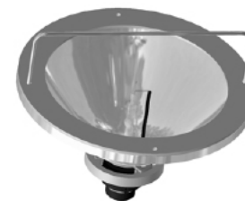
BULB REMOVAL TOOL

**Jedes der Modelle der Produktlinie ML-3500MS ist mit den für das Zielland passenden Wechsel-/Gleichstrom-Anschlusskabeln und Batterieladegeräten ausgestattet.